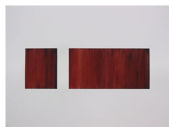
LA PAUSA. Papel XIII. 50x70 cm. 2003. Mixta sobre papel.