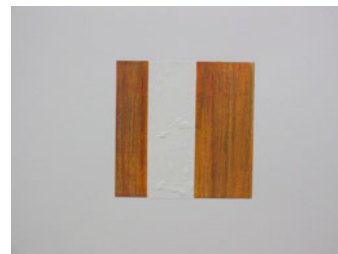
LA PAUSA. Papel III. 50x70 cm. 2004. Mixta sobre papel.