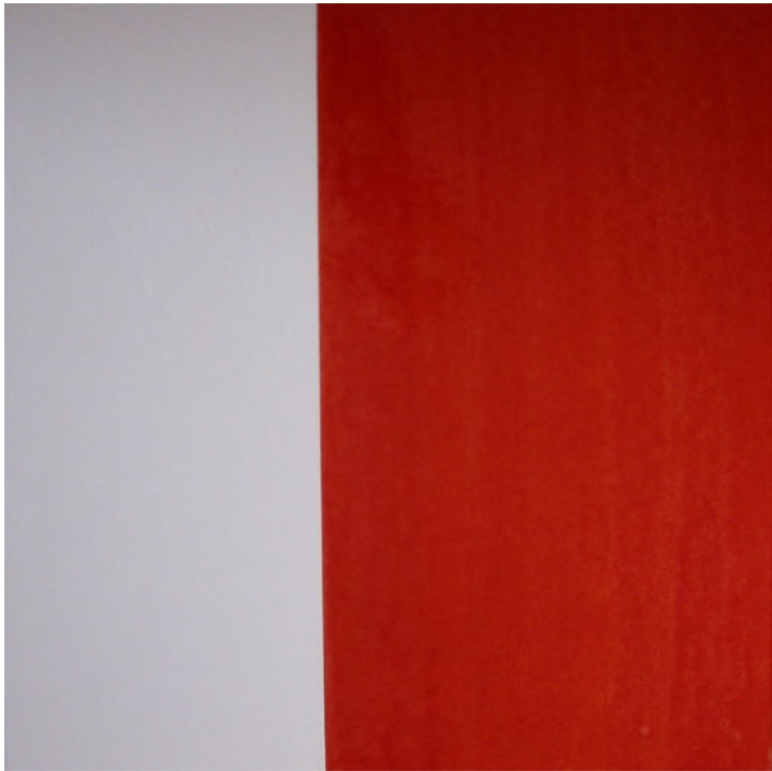
LA PAUSA. Pintura IV. 60x60 cm. 2003. Mixta s/ tela s/ tabla