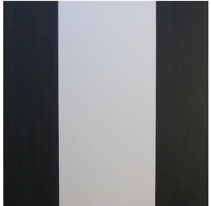
LA PAUSA. Pintura XII. 120x120 cm. 2003. Mixta s/ tela s/ tabla