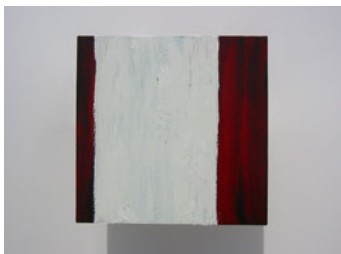
LA PAUSA, Serie menor II. 20x20 cm. 2004.Mixta s/ tela s/ tabla