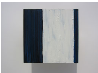
LA PAUSA, Serie menor IV. 20x20 cm. 2004.Mixta s/ tela s/ tabla