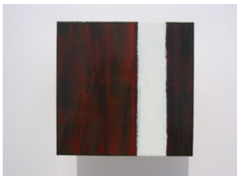
LA PAUSA, Serie menor III. 20x20 cm. 2004 .Mixta s/ tela s/ tabla,